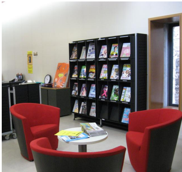
le coin des revues