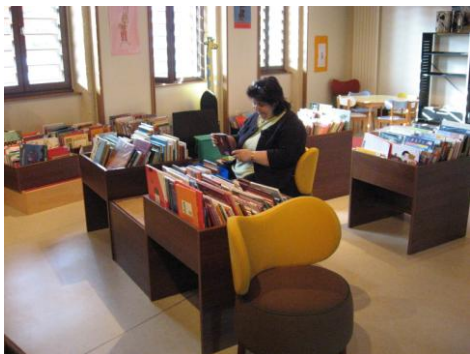
l'étage des enfants