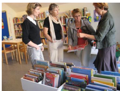
Une partie du groupe des visiteurs Salle des enfants à Châtillon

Nous remercions les responsables des bibliothèques qui ont bien voulu nous recevoir et qui nous ont communiqué leurs statistiques de l'année 2008.