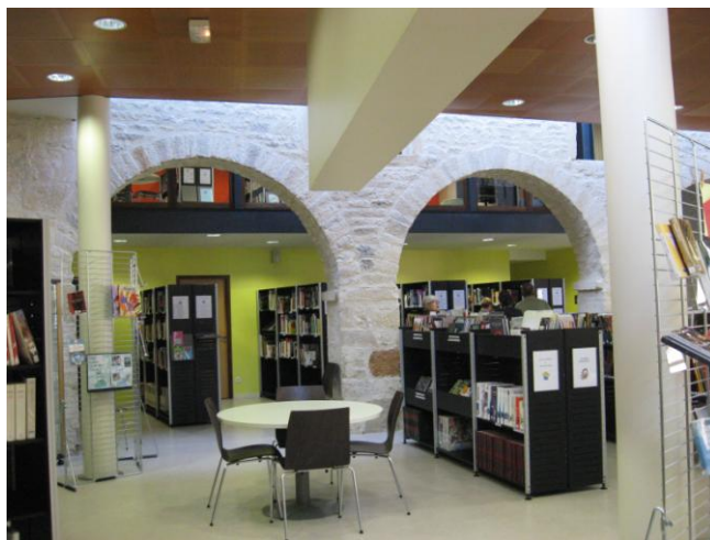
La grande salle du rez-de-chaussée. Les livres pour les adultes.